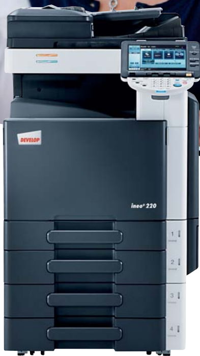
ineo+ 220 mit Originaleinzug (DF-617) und 2x 500 Blatt Papierkassette (PC-207)