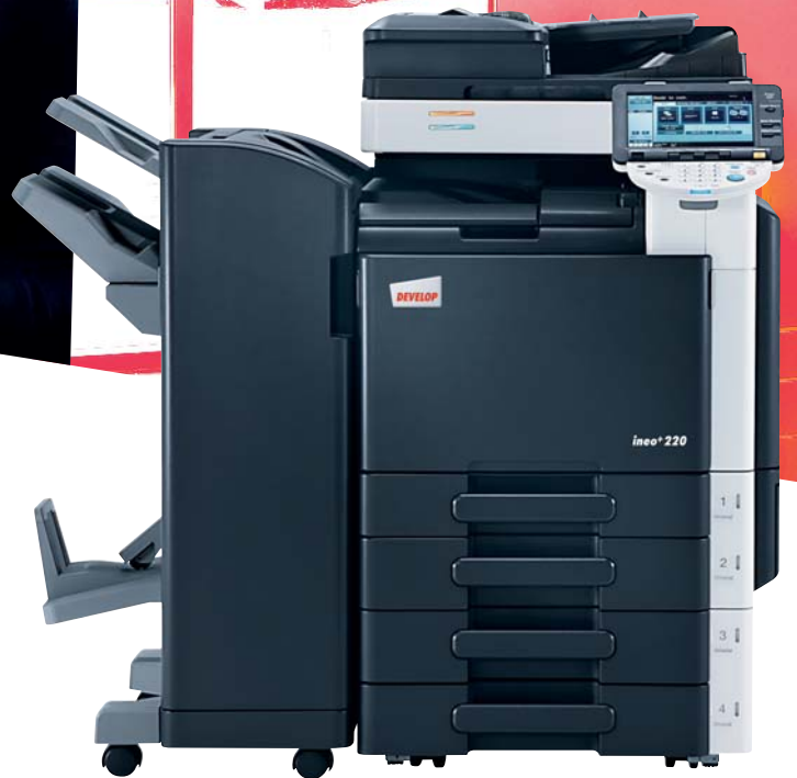
ineo+ 220 mit Originaleinzug (DF-617), Standfinisher (FS-527), Rücksticheinheit (SD-509) und 2x 500 Blatt Papierkassette (PC-207)